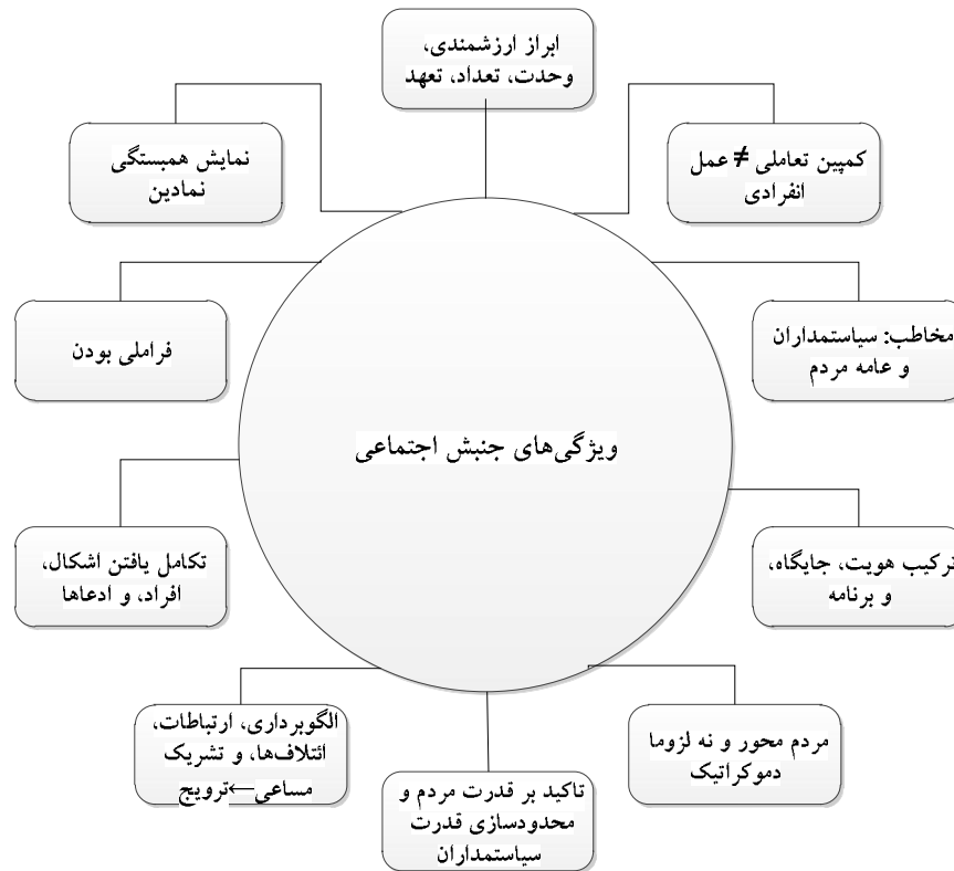
نمودار شماره ۱: ویژگی‌های جنبش اجتماعی

هر جنبش اجتماعی باید به نوعی ویژگی‌های ارزشمندی، وحدت، تعداد، و تعهد را نشان دهد. این ویژگی‌ها تعیین یافتن یک تظاهرات موفق و البته تأثیرگذار را مشخص می‌کند (تیلی، ۱۳۹۴: ۳۳۱). باید توجه داشت که ابراز این چهار ویژگی از اهمیت فراوانی برخوردار است زیرا حامل پیام‌های مهم سیاسی است و با دیگر ویژگی‌های خاص جنبش‌های اجتماعی همچون مشارکت‌جویان، بیانیه‌ها، مصاحبه‌های مطبوعاتی، جزوه‌ها، بستن روبانی با رنگ خاص و یا پوشیدن لباس‌های هم‌رنگ و هم‌سان، به‌کارگیری نمادها و نشان‌های خاص، اهتزاز پرچم، و یا حتی حضور ساده در جمعیت مرتبط است (polletta, 2002: 65). ابراز این چهار ویژگی ارتباط مستقیم با یکی دیگر از ویژگی‌های جنبش‌های اجتماعی دارد: ادعاهای مرتبط با هویت، جایگاه، و برنامه.